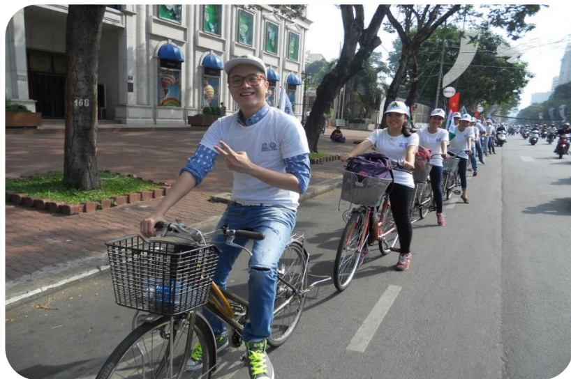
Cùng Tình Nguyên viên đạp xe diễu hành tại chương trình “Ngày Xanh”