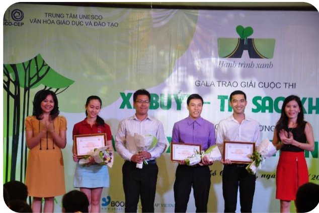
Nhà tài trợ đêm Gala trao giải Xe Buýt tại sao không? 10/05/2014