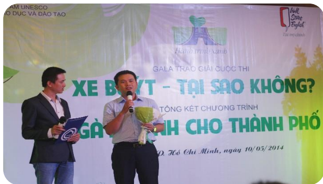
Đại diện sở GTVT TP.HCM phát biểu Trong đêm Gala 10/05/2014