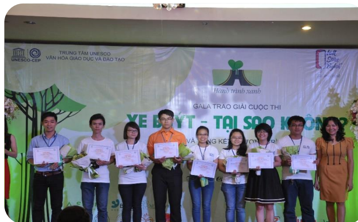
Trao giải Cuộc thi: Xe Buýt – Tại sao không? 25/3 – 10/05/2014