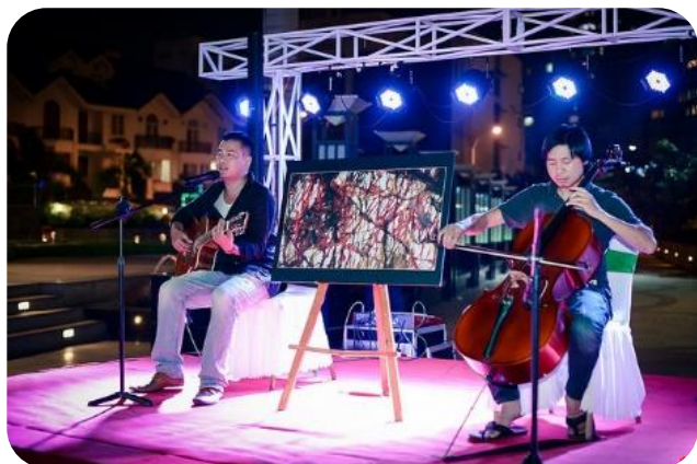
Triển lãm ảnh Tình Đá Bao Dung 20/2 – đến 23/2/2014