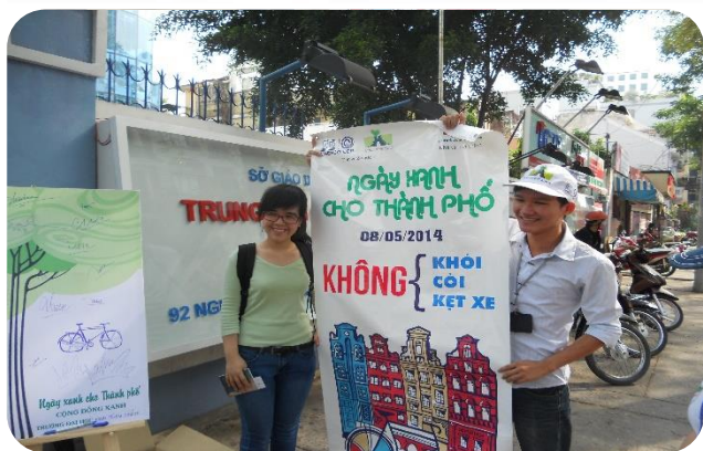
Hoạt động ký tên tại 20 trường Đại học trong Ngày Xanh Cho Thành Phố 08/05/2014