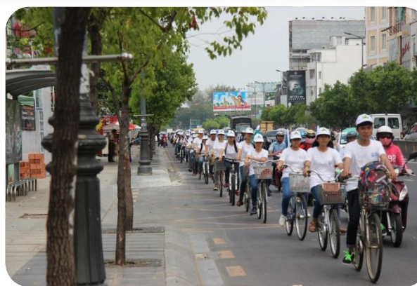
Hoạt động đạp xe tuyên truyền Ngày Xanh Cho Thành Phố 08/05/2014